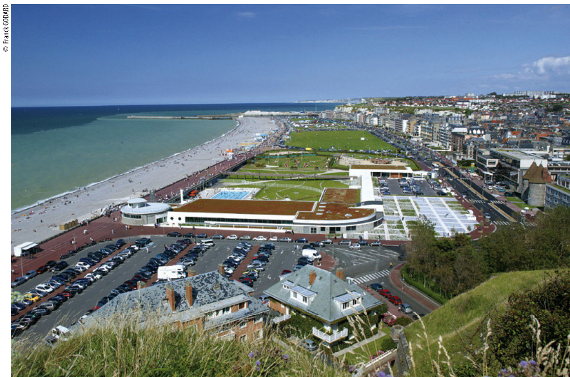
Le front de mer dieppois

Un accueil comme on les aime, un service aux petits oignons, un décor soigné et chaleureux qui laisse de l'espace entre les tables. Mais quand les assiettes arrivent, on se dit que dans le domaine de la cuisine authentique, de celle qui n'utilise que des produits et des recettes