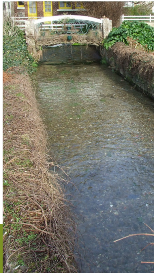
La Veules — le plus petit fleuve de France

Fermé du 10 novembre au 6 avril. Terrain de 3,5 ha. 152 emplacements. Emplacement + camping-car + 2 personnes + branchement à partir de 16 €. Animaux acceptés (1,50 et 2 €). Wifi payant. Petit épicerie. Piscine chauffée couverte. 300m de la mer et proximité centre village.