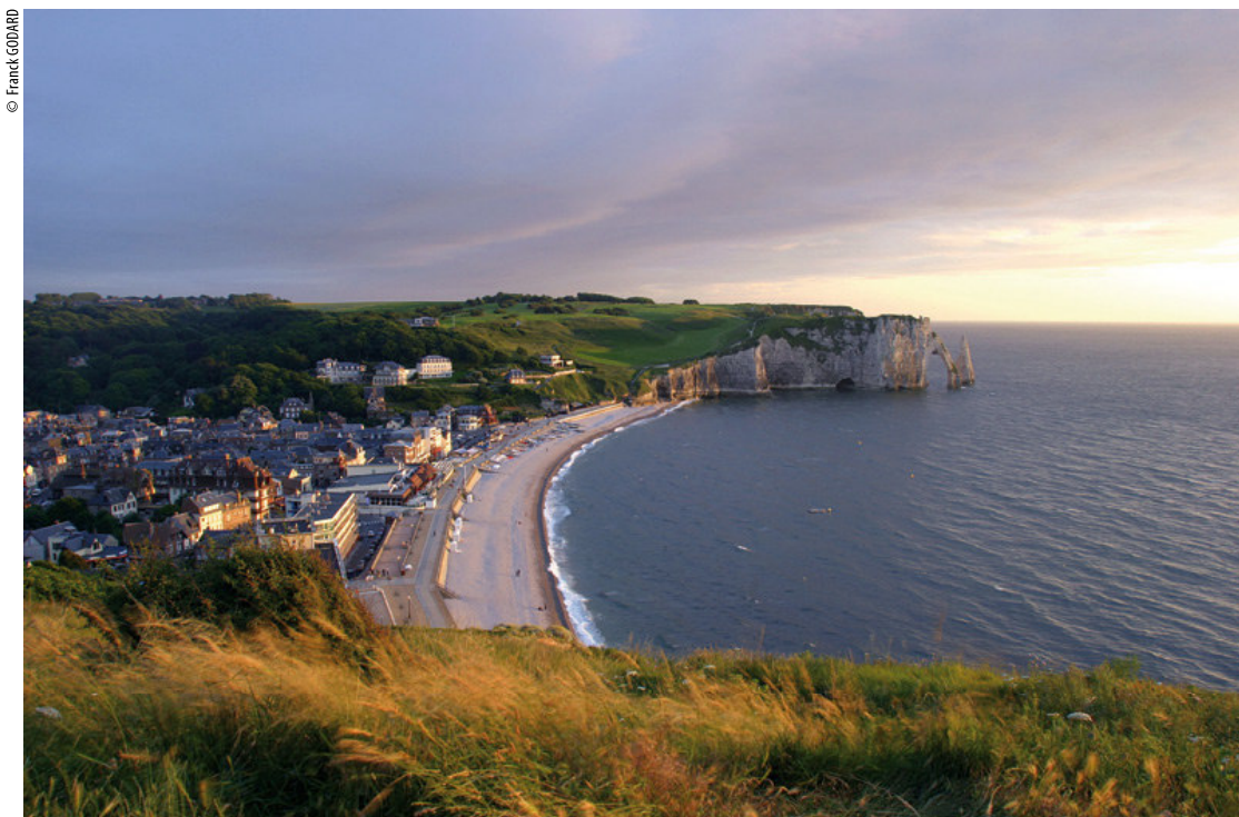
La station d'Etretat, entre les falaises d'Amont et d'Aval

Ouvert tous les jours le soir de 19h à 21h30 ; du vendredi au dimanche le midi de 12h à 14h. Menus de 25 € à 75 €. Carte : 36 € environ. Menu enfant : 15 €. Formule du midi : 25 € (du vendredi au dimanche). Panier pique-nique